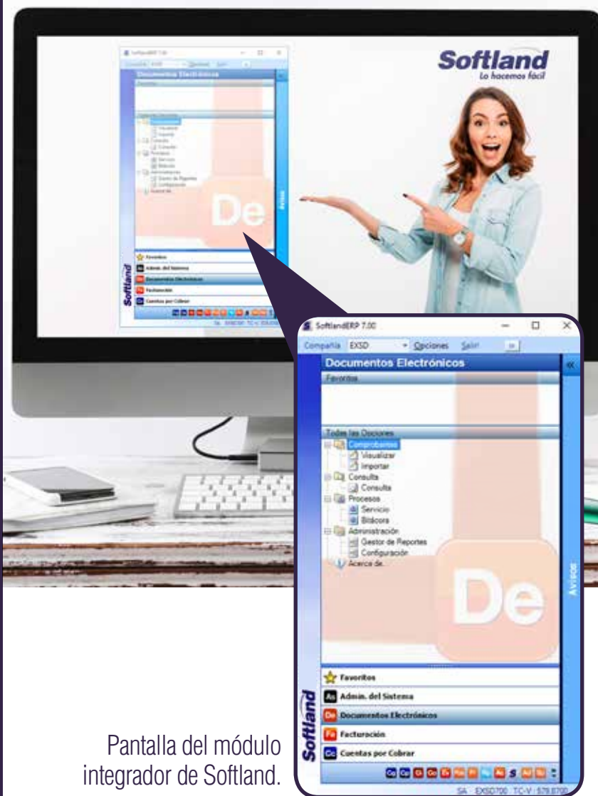
Pantalla del módulo integrador de Softland.